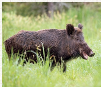
鳥獣害・ファン害の対策