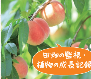
田畑の監視・植物の成長記録