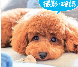
ペットの撮影・確認