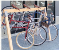
バイク・自転車の監視