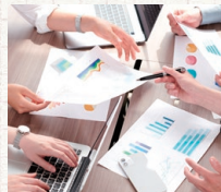
催事・会議を手動録画