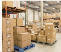
倉庫・物置の監視